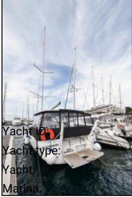
Yacht ID: Yacht type: Yacht Marina: