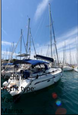
Yacht ID: Yacht type: Yacht Marina: