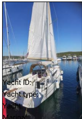
Yacht ID: Yacht type: Yacht: Marina: